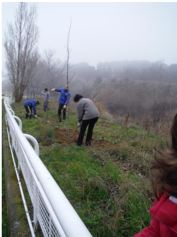
Voluntarios realizando la plantación