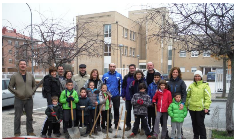
Grupo de voluntarios con sus familias