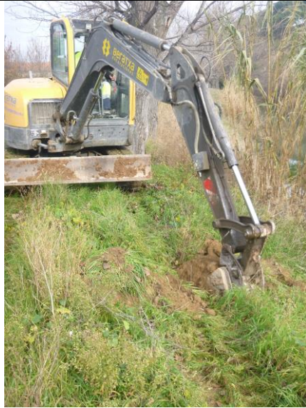
Maquinaria haciendo hoyas para las plantaciones