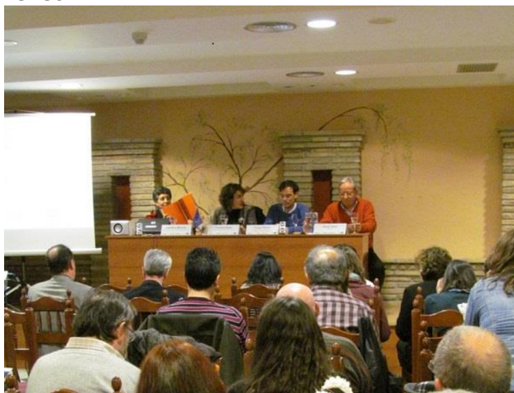
Celebración del día del agua (marzo de 2013)