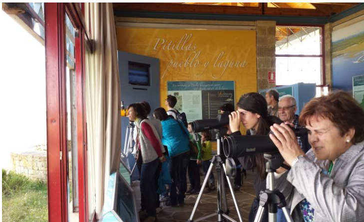
Visita al observatorio de aves de Pitillas