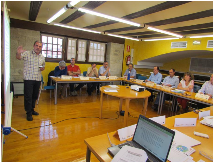
Reunión del grupo promotor del contrato de río Cidacos