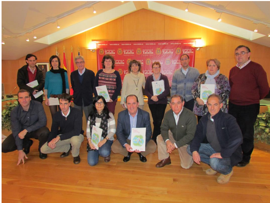
Representantes de las entidades locales del Cidacos, y grupo promotor del Contrato de Río. El 16 de diciembre de 2014 en Tafalla, manifestaron su interés en seguir profundizando y avanzando en el contrato del Río Cidacos.