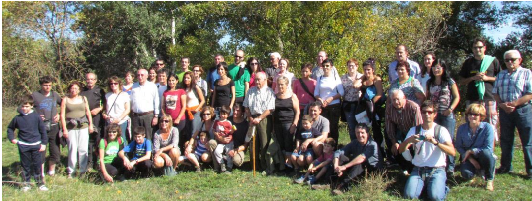
Asistentes a la 2ª ruta fluvial del Cidacos